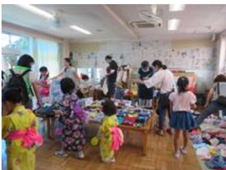
手作りのものもあってすてきな。