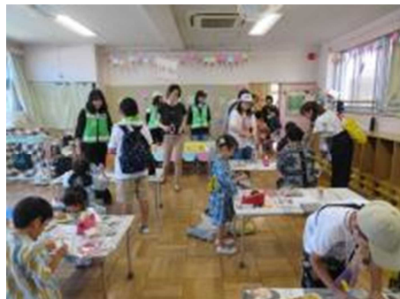
お面とアイスクリームけん玉作り、楽しいな!