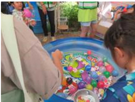
ねらって、ねらって…取れるかな。