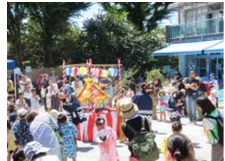
みんなで一緒に踊ったよ!