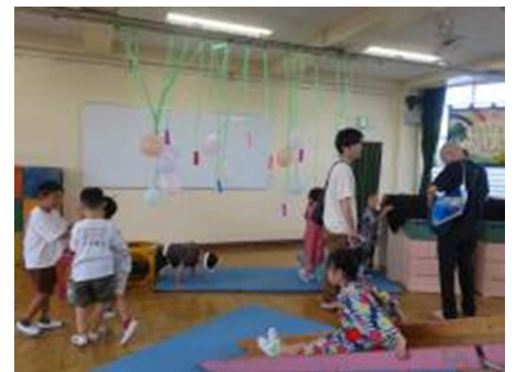
体を動かして、わくわく!